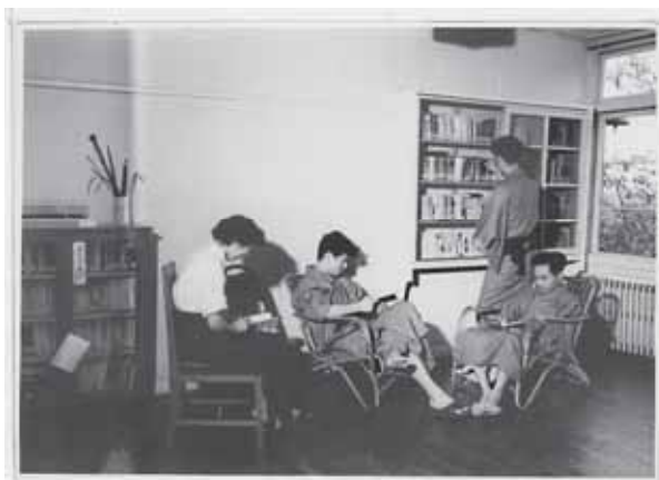
「△ツッカーハウス 図書室で過ごす患者さん」

時代は流れ、まもなく病院が100年を迎えようとしている中、こうした第三者の専門家から見た先人たちの活躍を思い返してみるのも一興ではないか。