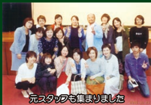
元スタッフも集まりました