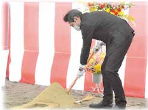
3月13日 新病院建築起工式