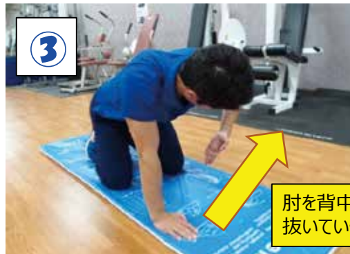
肘を背中方向へ抜いていく