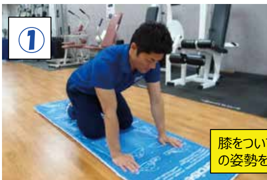
膝をついて四つ這いの姿勢をとる