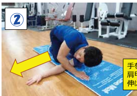
手を伸ばし肩甲骨周辺を伸ばす