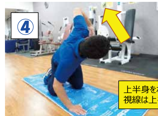
上半身をねじる視線は上を見る